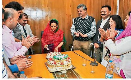
केएनएच में जन्म दिवस पर केक काटती प्रतिभा सिंह।

केएनएच में गरीब एवं जरूरतमंद अभिभावकों को अपने नवजात शिशुओं के लिए कपड़ों के लिए भटकना नहीं पड़ेगा। उन्हें अपने बच्चे के लिए अस्पताल में ही मुफ्त में कपड़े मिलेंगे। नगर निगम ने गरीब एवं जरूरतमंद अभिभावकों की मदद के लिए शिशु परिधान बैंक की शुरुआत की है। वीरवार को पूर्व सांसद प्रतिभा सिंह ने लेबर रूम के पास निगम के इस प्रथम शिशु परिधान बैंक का शुभारंभ किया। पूर्व सांसद ने इसके लिए निगम की सराहना की और कहा कि इससे गरीब एवं जरूरतमंदों को काफी सुविधा होगी। उन्होंने कहा कि केएनएच में रोजाना